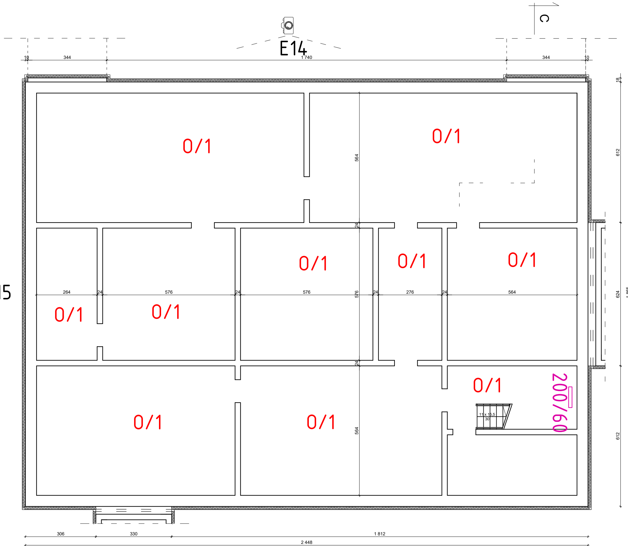
RZUT PIWNICY, Budynek Językowy